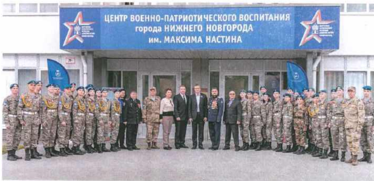
Рисунок – фотографии с торжественного открытия Автозаводского отделения Центра ВПВ 12 мая 2025 года

2. Съёмки программы «Разговоры о городе» с заместителем главы администрации города Нижнего Новгорода Л. Н. Стрельцовым.